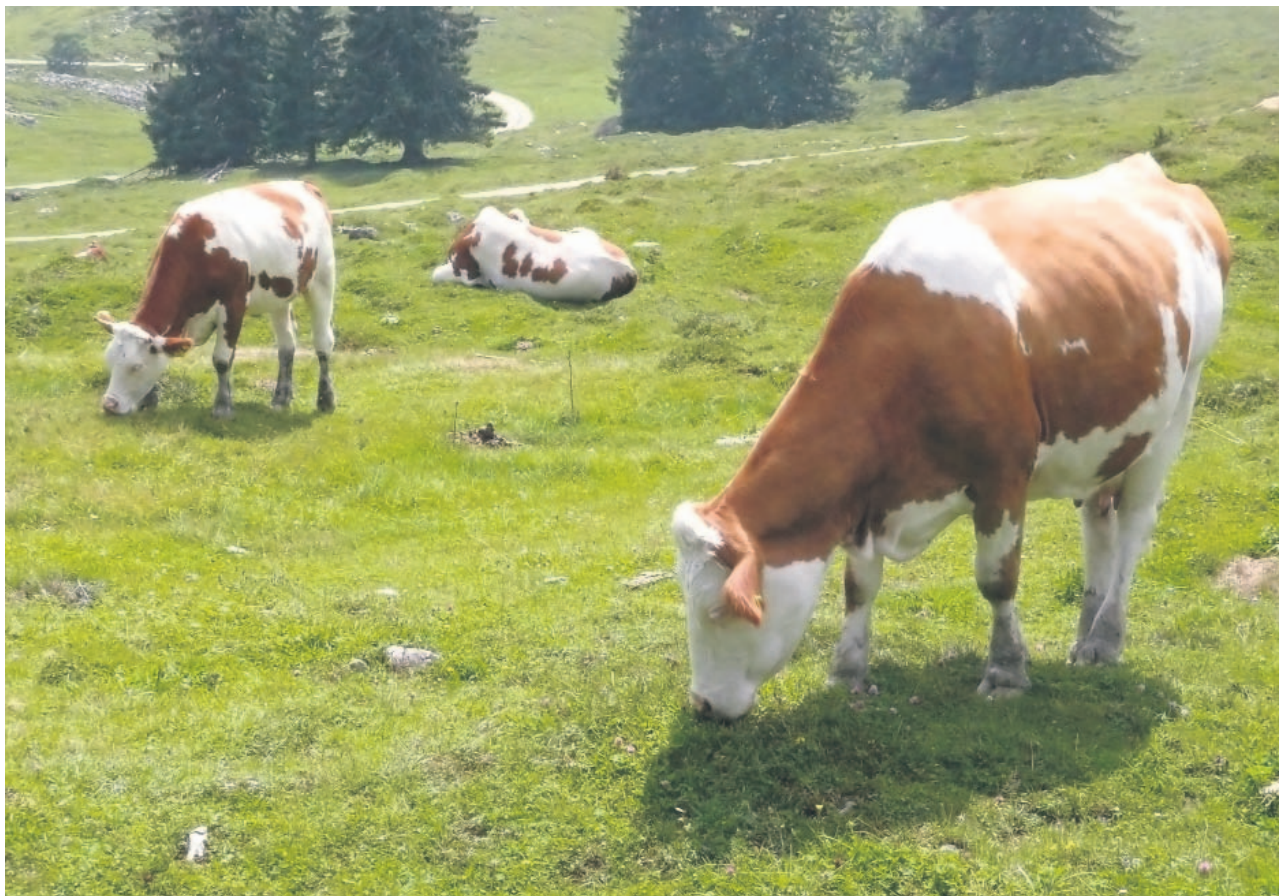
Wertschöpfungsstarke Milchverarbeitung als Ziel: Die Milchhof Liechtenstein AG, die inzwischen organisatorisch vom Milchverband getrennt ist, will innovative Produkte mit einer hohen Marge herausgeben.

Als Folge dieser Neuausrichtung hat der Milchverband schliesslich die Milchhof Liechtenstein AG gegründet und damit die organisatorische Trennung des Verarbeitungsbetriebs und der Genossenschaft vollzogen. «Mit diesem Schritt wurden die Organisationsstrukturen modernisiert